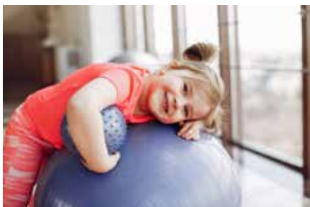
Sport von Anfang an.

Den Anfang der sportlichen Grundlage stellt unser Eltern-Kind-Turnen dar. Ab dem Alter von 18 Monaten kann es losgehen und das Turnen zieht sich, wenn man es möchte, bis ins Jugend- und Erwachsenenalter natürlich fort. Zusätzlich bietet die Leichtathletikabteilung (mit fast 500 Mitgliedern die größte Abteilung im Verein) ab dem Alter von drei Jahren ein kind- und altersgerechtes Training an.