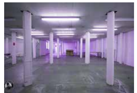
Im Garely-Haus gab's Platz für alles Mögliche

Der abendliche Publikumsverkehr über die Saar, das Nachtleben in Alt-Saarbrücken und damit auch die Attraktivität des Stadtteils werden bedauerlicherweise zurückgehen, wenn mit dem Garely-Haus und der sparte4 zwei wichtige Kulturstätten schließen. Alt-Saarbrücken droht dadurch erneut ein Stück weiter abgehängt zu werden.