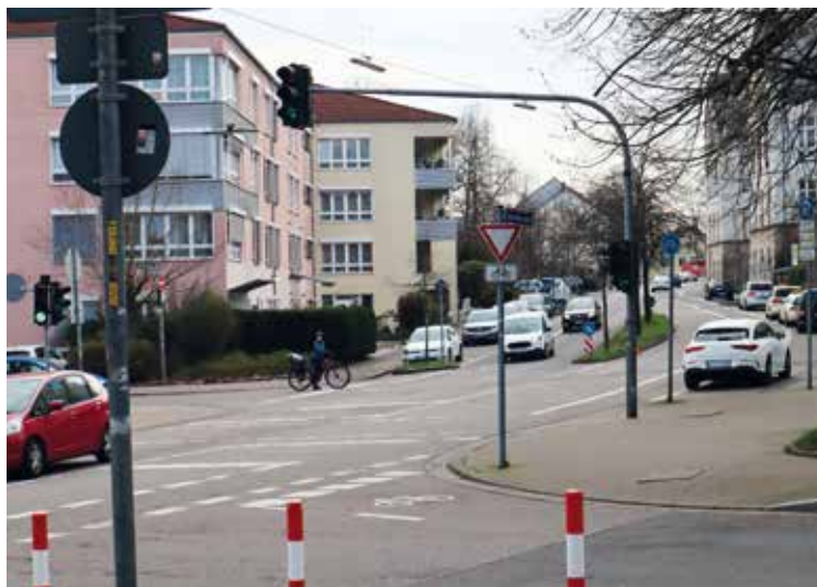
Deutschherrnstraße: Hier läuft es übersichtlich dank Radweg, Fußgängerüberweg und Tempo 30

Der SUMP-Prozess von Bund und Land gefördert. Er ist Teil eines noch größer angelegten Plans.