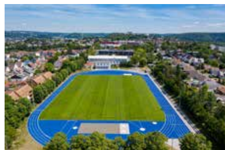
Auf der Bellevue in Alt-Saarbrücken bietet die Sportanlage viel Platz für das breite Angebot.

Der ATSV bietet als Traditionsverein so viel und ist seit 1848 eine Instanz im Sport für Groß und Klein in Alt-Saarbrücken und auch für die ganze Stadt. Einfach vorbeikommen und mal „Schnuppern“ und wem es gefällt, der meldet sich an. Infos unter: www.atsv-sb.de