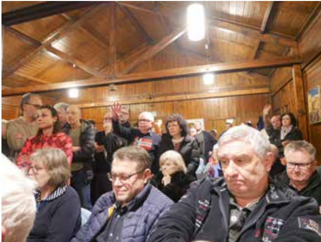
Die Notkirche ist voll, der Austausch in vollem Gange. Alt-Saarbrückerinnen und Alt-Saarbrücker wollen Antworten und konkrete Lösungsvorschläge.