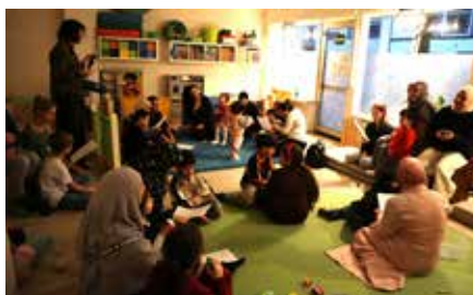
Dämmerung im Familienhaus "Apfelbaum"

Neue begangen: mit einer Dattel, die den Körper auf das Essen vorbereitet und einem Gebet auf dem Gebetsteppich in Richtung der Kaaba (der heiligen Andachtsstätte in Mekka). Häufig trifft man sich dazu mit Familie, Freunden oder in der Gemeinde. Der Vorschlag,