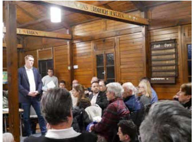
Vertreter der Stadt Saarbrücken, des Ordnungsamts, des Umweltministeriums, der unteren Jagdbehörde sowie der Kontaktpolizei stehen Rede und Antwort.

Verwüstete Gärten, kaputte Spielplätze, durchwühlte Mülleimer. Die Wildschweine hinterlassen auf der Suche nach Nahrung Chaos in unserem Stadtteil. Hinzu kommen Unsicherheit und Ängste im Umgang mit den Paarhufern. Auf dem Wildschweingipfel im Februar, organisiert durch den SPD-Ortsverein Alt-Saarbrücken, geht es um klare Lösungen zur angespannten Situation.