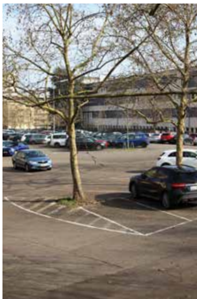
Die Umgestaltung vom Roonplatz lässt noch auf sich warten, aber: Er ist die zentrale Fläche in Nachbarschaft von drei weiterführenden Schulen! Da sollten auch die Jugendlichen mitreden.

nen und Bewohnern dient, ohne das Leben im Stadtteil zu beherrschen? Beteiligen Sie sich und treffen Sie ihre Entscheidung, denn nur dann kann sie in den neuen Mobilitätsplan eingehen.