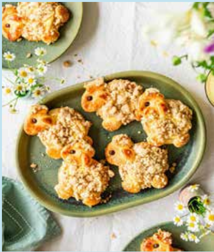
Rezept und Foto: Tante Fanny Frischteig GmbH

Klar, selbstgemachter Teig ist immer am besten. Allerdings gibt es viele Menschen, bei denen gerade Hefeteig nicht richtig gelingen will. Oder man gehört zu der ungeduldigen Sorte, die gleich loslegen will und nicht ewig dem Teig beim Gehen zuschauen möchte.