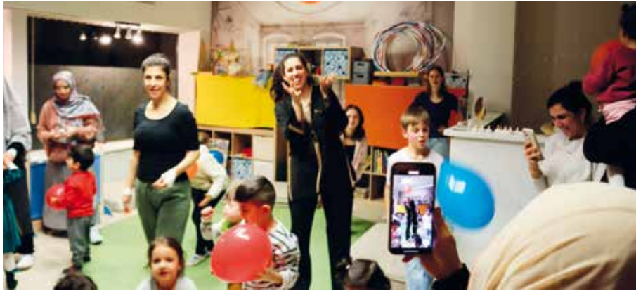
Nach dem Essen gab es für die Kinder noch ein kleines Bewegungsspiel mit Luftballons zu weiteren Ramadanliedern.

derung gefolgt und kamen voll bepackt: zum Beispiel mit einer ganzen Palette Ayran. Ebenso wurde selbst gemachtes Ayran mitgebracht. (Hierzu wird ein großer Löffel Naturjoghurt in ca. 1 Liter leicht erwärmte Milch eingerührt. Ein paar Stunden stehenlassen. Fertig!)