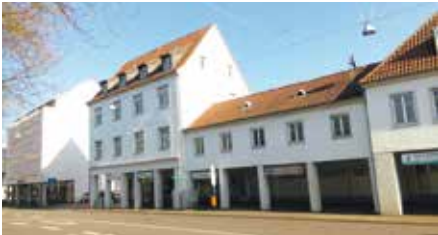
Bye bye Garely-Haus. Gute Reise allen Künstlerinnen und Künstlern. Es ist wirklich traurig.

Dieser Text ist einer von zahlreichen Abschiedsbriefen. Trotzdem, es muss nochmal gesagt werden.