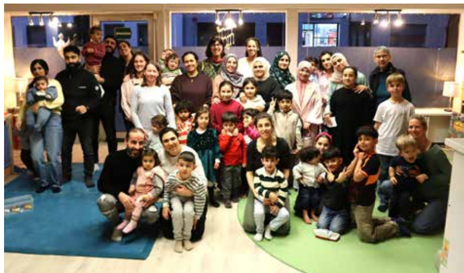
Es hatte viele leuchtende Augen gegeben und die Familien bedankten sich für diesen besonderen Abend. Am Ende wurde gemeinsam aufgeräumt und sich herzlich verabschiedet.